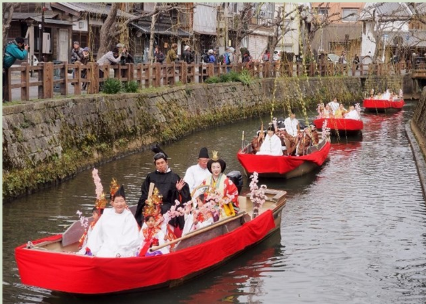
小野川を優雅に進む水上雛祭り